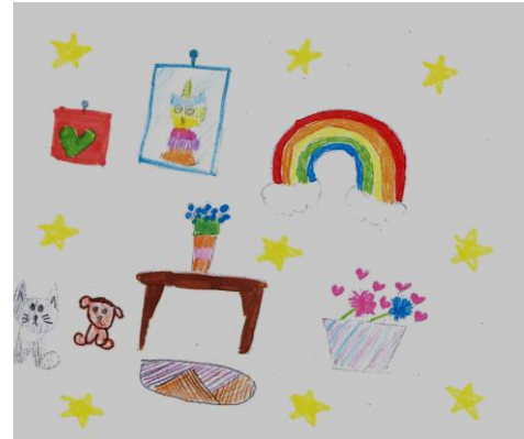
Σταυρούλα Γυφτάκη - Β' Δημοτικού