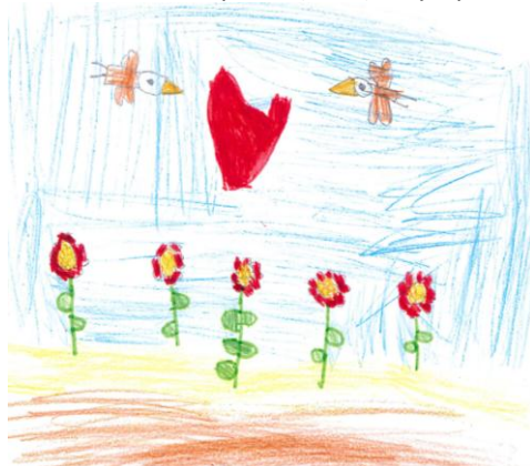
Μανώλης Ζερβάς - Α' Δημοτικού