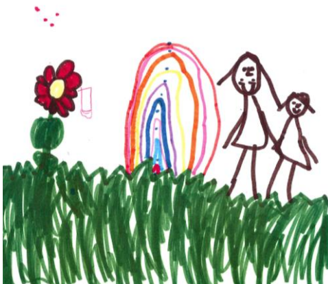
Ευσταθία Κουρούπη - Νηπιαγωγείο

Well done to all our students who took part in the Mother's Day Writing and Drawing Competitions. The drawings and pieces of writing were, as always, absolutely wonderful. Our winners this year were: